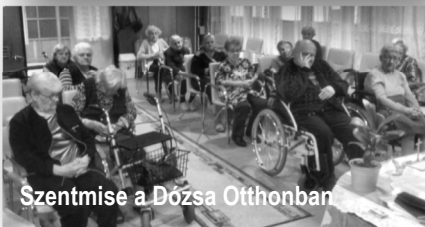
Szentmise a Dóza Otthonban

Köszönettel fogadjuk, ha 200 Ft adománnyal hozzá tud járulni újságunk előállítási költségeihez.