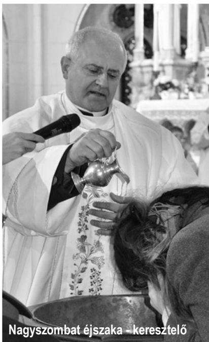
Nagyszombat éjszaka - keresztelő

„Íme a szent keresztfa, Rajta függött valaha a világnak váltsága. Jöjjetek, hát keresztények, hódolattal hajtsunk térdet, üdvözlégy szent keresztfa!”