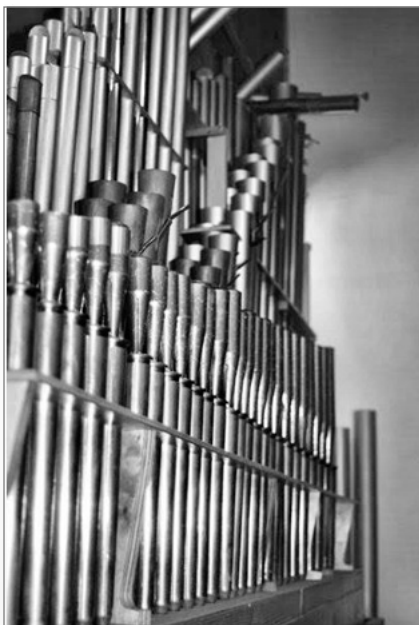
A képen az orgona egyik legértékesebb sípsora, a Vox Humana látható. Az alatta lévő fadoboz a hibás szelláda