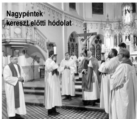
Nagy péntek kereszt előtti hódolat

“MenjeteK, tegyeteK tanítványommá mind a népeket! KereszteljeteK meg őket az Atya, a Fűú és a Szentlélek nevére, és tanítsátok meg őket mindannak megtartására, amit parancsoltam nekteK. S én veleteK vagyok minden nap a világ végéig.” (Mt 28,19-20)