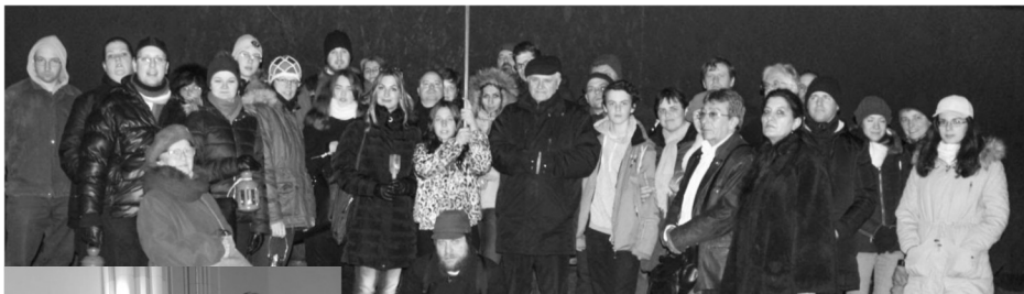
Nagycsütörtök: éjszakai keresztút