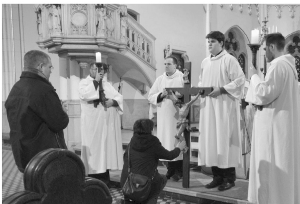
Nagypéntek: Hódolat a Szent Kereszt előtt