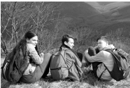
Két csúcs megmászása (Három-kő, Tar kő) - 21 km - 17 fő - sok fiatal túratárs