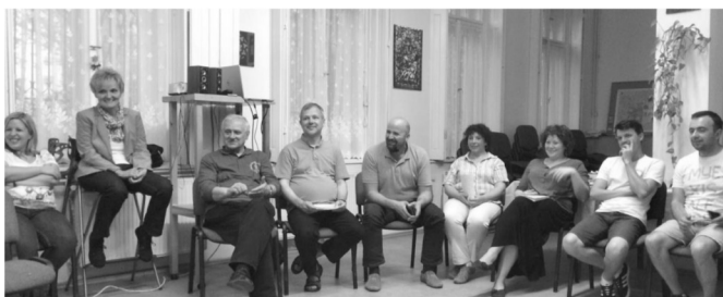
Vendégünk volt egy marosvásárhelyi plébániai küldöttség