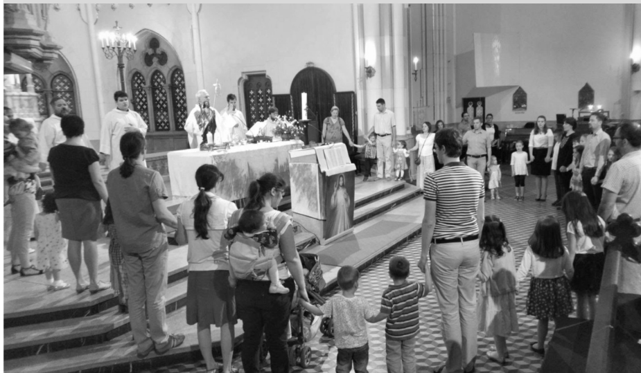
A közös Miatyánk ima egy vasárnap délelőtti szentmisén