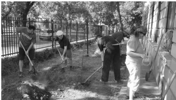
A Munkás Szent József csoport szervezésében közösségi munkálkodás a plébánián