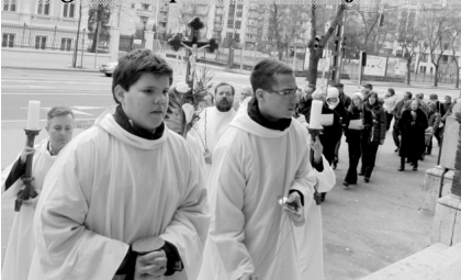
Virágvasárnap: Jézust követjük!