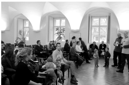
Az egri szeminárium dísztermében

„Sok minden volt-maradt bennem. Volt azonban egy ének, amit még nem ismertem ezidáig. A egyik zárósora: Hálát adok, hogy ma reggel még hálát adhatok! Azóta ez zakatol bennem, és néha nem győzöm gyűjteni, mennyi mindenért hálát adhatok. Számomra ez a legnagyobb ajándék, segítség és kegyelem azóta.